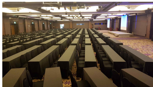
거문고 ABC(3층) 총 600석 (A-200석, B-200석, C-200석)