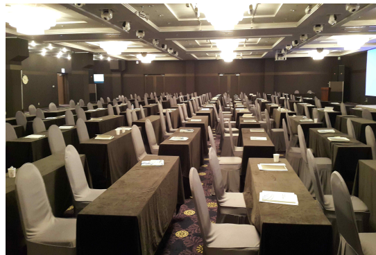
가야금 AB홀(2층) 총400석(A-200석, B-200석)